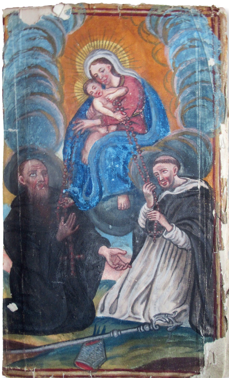
3. Księga bracka