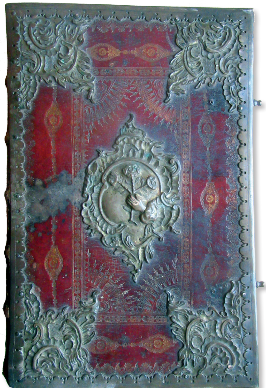
1. Księga bracka