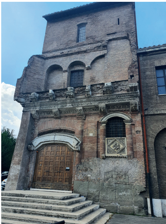
1) Casa dei Crescenzi – widok ogólny