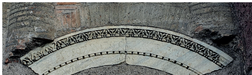
7) Casa dei Crescenzi – inskrypcja powyżej zamurowanego bocznego wejścia