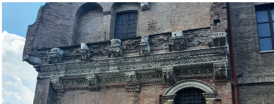
2) Casa dei Crescenzi detale – konsle, architraw i fryz