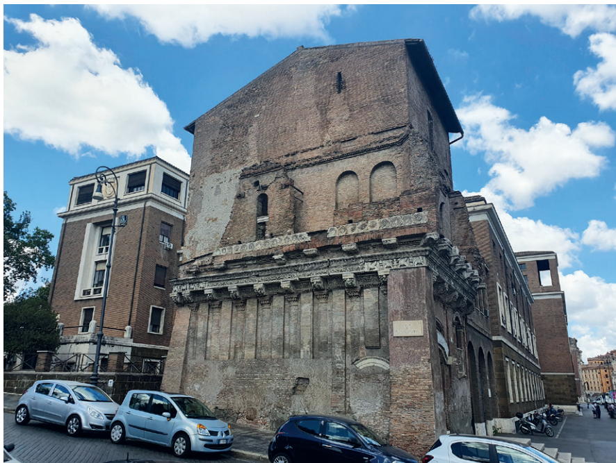
3) Casa dei Crescenzi – boczna fasada od Via di Ponte Rotto – kopia