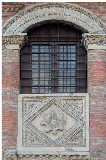
5) Casa dei Crescenzi – inskrpcja powyżej okna