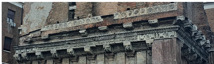
6) Casa dei Crescenzi – detale bocznej fasady od Via di Ponte Rotto