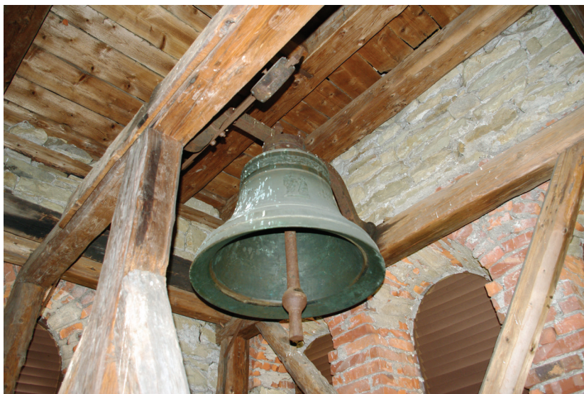
Ilustracja 61. Dzwon w wieży kościoła.

Na tym poziomie znajdują się charakterystyczne, trójdzielne, łukowo sklepione okna, wypełnione metalowymi żaluzjami chroniącymi wnętrze przed opadami i wiatrem. Żaluzje zapewniają też prawidłowe rozchodzenie się dźwięku dzwonów i regulację jego zasięgu.