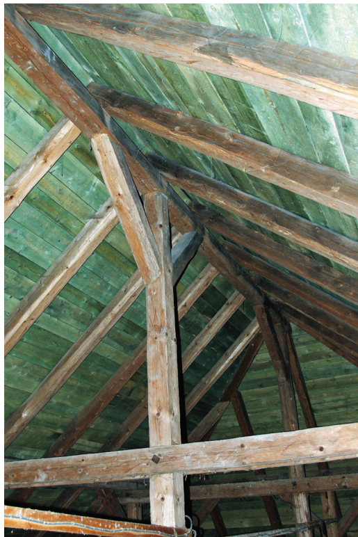
Ilustracja 62. Więżba dachowa nawy

Nawa i prezbiterium nakryte są oddzielnymi, niezbyt stromymi dachami. Nawa – dachem trójspadowym, a prezbiterium – dwuspadowym, krytymi