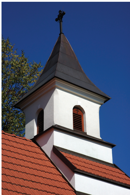
Ilustracja 63. Wieżyczka nad prezbiterium.

Na masywnej, murowanej podstawie, wspartej na podwójnych łukach przed apsydą, wznosi się zgrabna, czworoboczna forma – z fazowanymi narożnikami, łukowo sklepionymi otworami zamkniętymi żaluzjami. Smukły, czterospadowy dach sygnaturki pokryty jest blachą miedzianą, układaną w poziome pasy.