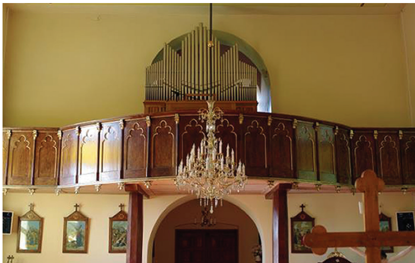
Ilustracja 59. Chór muzyczny.

Nad wejściem do nawy, przy jej zachodniej ścianie, znajduje się chór muzyczny, tworzący półkoliście uwypukloną galerię, wspartą na dwóch ośmiobocznych, ręcznie ciosanych, drewnianych słupach, poszerzonych dołem przez obicie deskami (Ilustracja 59).