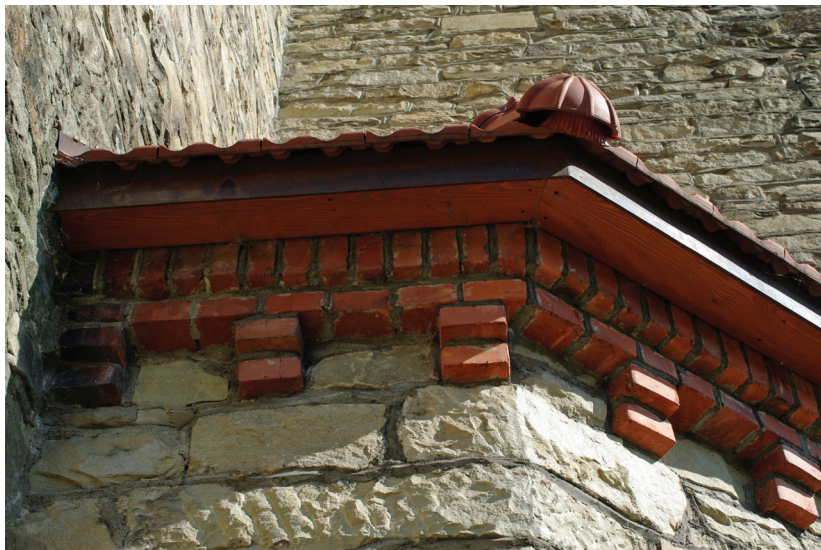
Ilustracja 65. Ceglany gzymś wieńczący ściany.

Gzymś prezbiterium i apsydy, zbudowany z trzech ćwierćlukowych wkłések, jest tynkowany i pochodzi z okresu budowy pierwszej kaplicy.