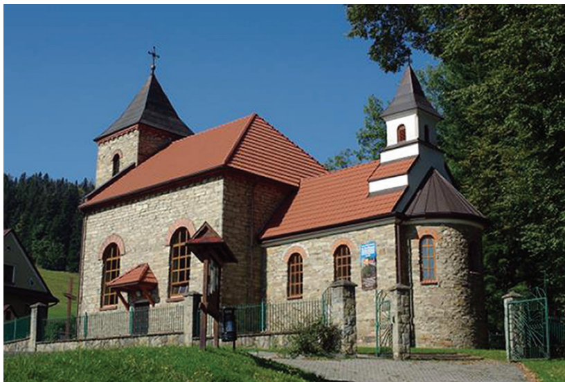
Ilustracja 57. Widok kościoła od strony szosy.

Apsyda mieszcząca obecnie zakrystię, schowaną za szafą głównego ołtarza, to kwintesencja architektury sakralnej dawnych wieków i stały element bazylik wczesnochrześcijańskich, a także romańskich i gotyckich kościołów, powracający do architektury sakralnej w okresie historyzmu. Piękna i surowa – z dwoma zwieńczonymi pełnymi łukami oknami, sklepią półkuliście, z prostym krzyżem na ścianie – przywodzi na myśl wnętrza średniowiecznych kościołów. Pomiedzy apsydą a prezbiterium wymurowano dwa masywne, bliźniacze łuki, które stanowią konstrukcyjną podstawę sygnaturki.