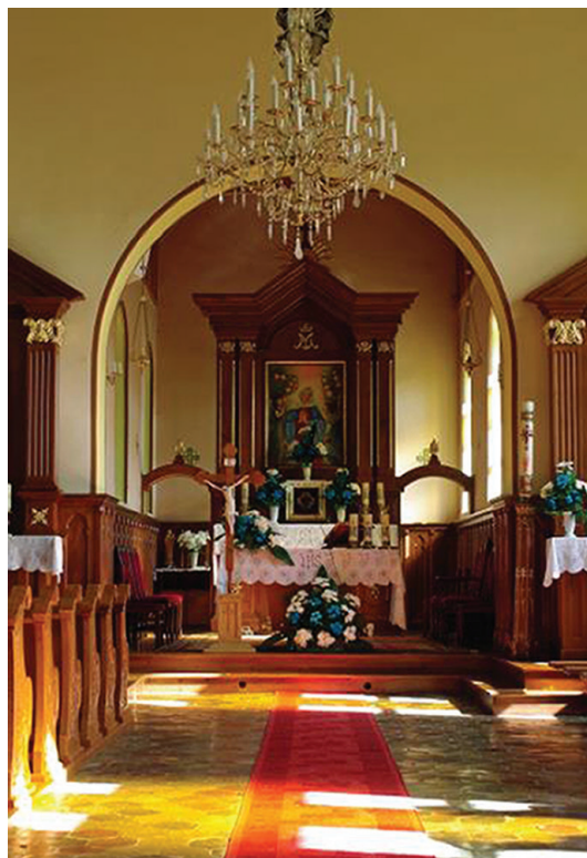
Ilustracja 58. Wnętrze kościoła.

Prezbiterium poprzedzone jest wyraźnie większą, wzniesioną na planie kwadratu nawą. Pomiedzy nawą a prezbiterium znajduje się nieco przysadzisty łuk tęczy, nad którym namalowano na ścianie krucyfiks. Łuk ten rozdziela dwie części kościoła, podkreślając ich odrębność, a zarazem stanowiąc element konstrukcyjny ściany szczytowej nawy. Po obu stronach łuku na ścianach prezbiterium postawiono dwa drewniane, współczesne ołtarze, nawiązujące stylistycznie do ołtarza głównego, wykonane przez zakład stolarski Gawła. Ołtarz po lewej stronie poświęcony jest papieżowi Janowi Pawłowi II. W ołtarzu po prawej stronie nawy umieszczono obraz, wykonany w 1895 roku i przeznaczony do budującej się dopiero kaplicy. Oto jak w pamiętniku kościółka pisze o tym ks. Ślósarz: