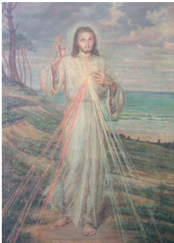
14. Adolf Hyla, Chrystus Miłosierny (na tle morza) , olej na płótnie, 1949, Gdynia Orłowo, kaplica sióstr elżbietanek

morskim brzegu (il. 14). Po lewej stronie widoczne są skarłowaciałe sosny rosnące na zboczu. W oddali widać falujące morze o lazuruwo-błękitnych odcieniach. Morze w kolorze lazuruwym faluje delikatnie, odbijając się o falochrony. Takie przedstawienia możemy znaleźć w domu zakonnym sióstr elżbietanek w Gdyni Orłowie 52 , w kościele parafialnym pw. Bożego Miłosierdzia na Helu 53 czy w kaplicy u sióstr elżbietanek w Gdańsku 54 .