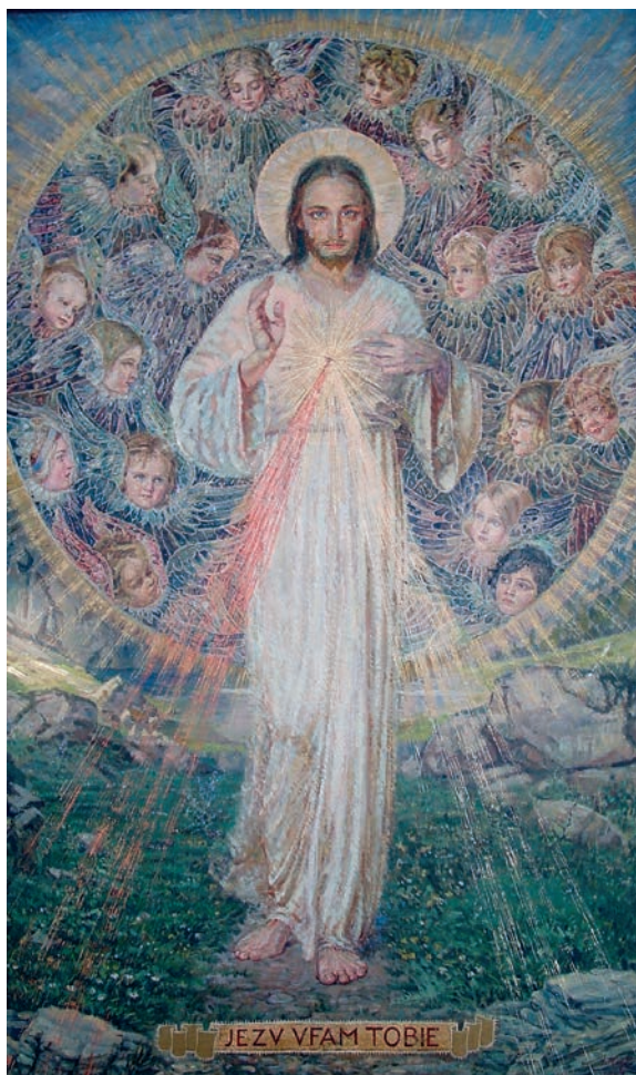
13. Adolf Hyla, Chrystus Miłosierny z główkami aniołków , olej na płótnie, 1947, Miejsce Piastowe, kaplica zakonna księży michalitów