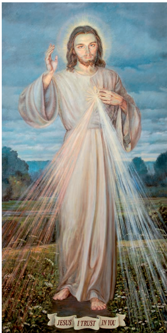
10. Adolf Hyla, Chrystus Miłosierny (na tle krajobrazu), olej na płótnie, 1952, Melbourne (Australia), kościół pw. NMP Gwiazdy Morza

jest obraz znajdujący się w świątyni parafialnej pw. Ducha Świętego w Katondwe w Zambii 43 . Ściany pomieszczenia są koloru szarego, a Jezus idzie po kamiennej podłodze pokrytej czarno-białymi płytkami w kształcie szachownicy. Biały obłok otacza nogi Chrystusa i rozchodzi się na posadzce. W niektórych przypadkach tło obrazu stanowią brązowe, wąskie, drzwi, zamknięte od wewnątrz na metalową zasuwę. Z drugiej strony widoczne są dwa masywne zawiasy umocowane na odrzwiach. Ściana wykonana jest z ciemnego marmuru. Możemy to zobaczyć