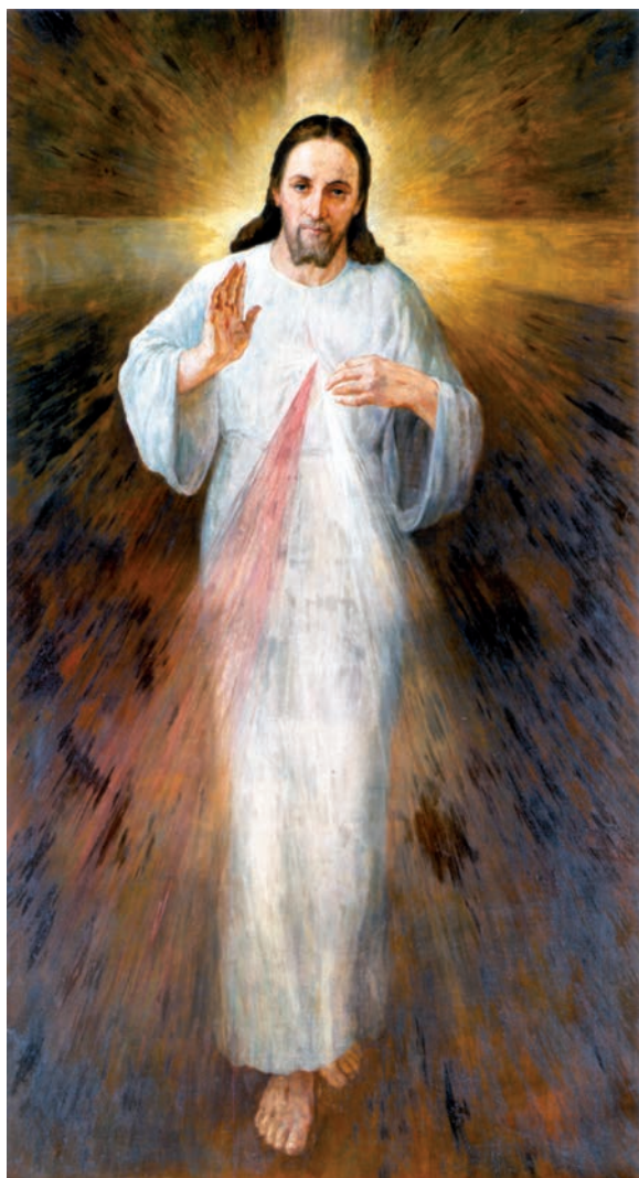
3. Stanisław Kaczor Batowski, Chrystus Miłosierny , olej na płótnie, 1943, Kraków, kościół Miłosierdzia Bożego