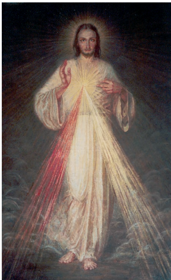
16. Adolf Hyla, Chrystus Miłosierny (na tle obłoków), olej na płótnie, 1947, Kraków, kościół siostr sercanek pw. Najświętszego Serca Pana Jezusa