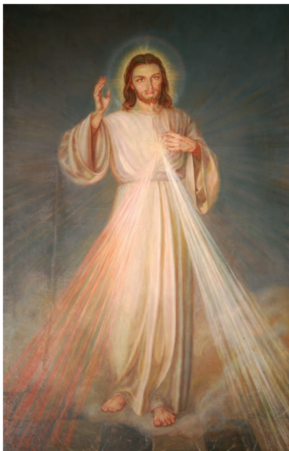
12. Adolf Hyla, Chrystus Miłosierny (tło ciemnym), olej na płótnie, 1953, katedra pw. Wniebowzięcia NMP, Włocławek, fot. APSz