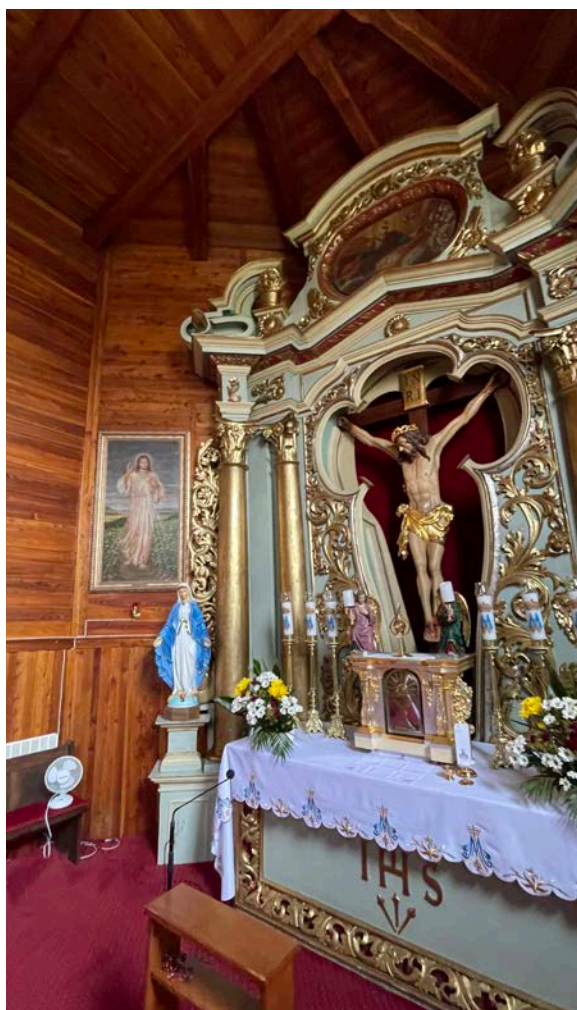
8. Prezbiterium, Stradów, kościół parafialny pw. św. Bartłomieja

oddaje najpełniej ducha nabożeństwa, w którym czcimy nie tylko ludzkie miłosierdzie Jezusa, lecz przede wszystkim miłosierdzie Trójcy Świętej 15 .