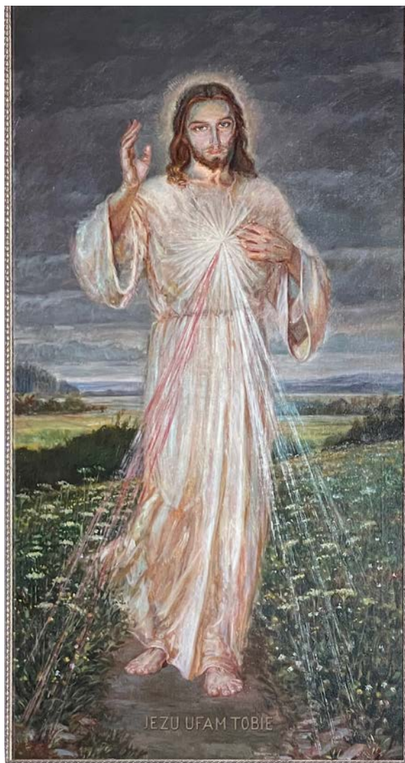
9. Adolf Hyla, Chrystus Miłosierny , olej na płótnie, 1948, Stradów, kościół parafialny pw. św. Bartłomieja

Obraz Jezusa Miłosiernego stanowi wizualne streszczenie i przedstawienie całego nabożeństwa do Miłosierdzia Bożego, ale przede wszystkim jest wezwaniem do ufności w Boże Miłosierdzie. Ufność, która jest odpowiedzią człowieka na Miłosierdzie Boże, otwiera serca ludzi na przyjęcie darów tegoż Miłosierdzia i powoduje Jego działanie w nas. To ona jest gwarantem dla ufającego nie tylko zbawienia