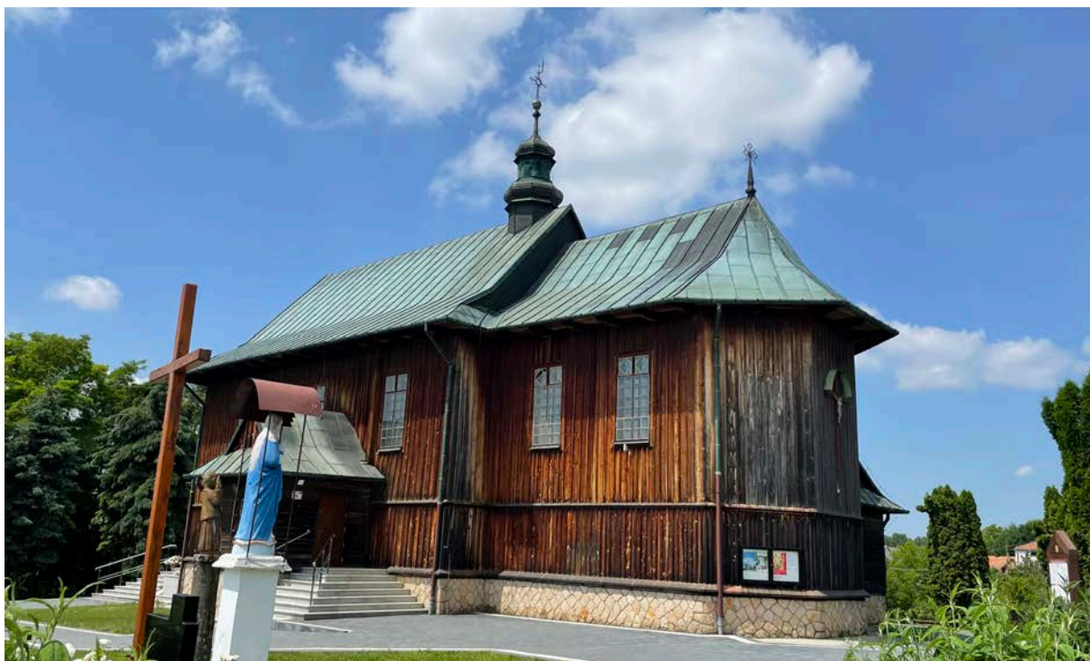
7. Kościół pw. św. Bartłomieja w Stradowie

kwerendy okazało się, iż kronika parafialna z tamtego okresu nie istnieje. Uniemożliwiło to w znacznym stopniu ustalenie konkretnych faktów na temat fundacji malowidła. Z relacji Zbigniewa Lenartowskiego wynika, iż w ludzkiej pamięci zatarła się historia obrazu z racji remontu, a właściwie rozbioru starego kościoła i budowy obecnego 12 .