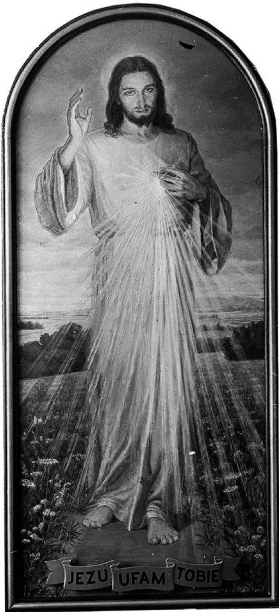
5. Adolf Hyla, Chrystus Miłosierny , olej na płótnie, 1944, Kraków, kaplica Zgromadzenia Matki Bożej Miłosierdzia, stan pierwotny, fot. A. Hyla