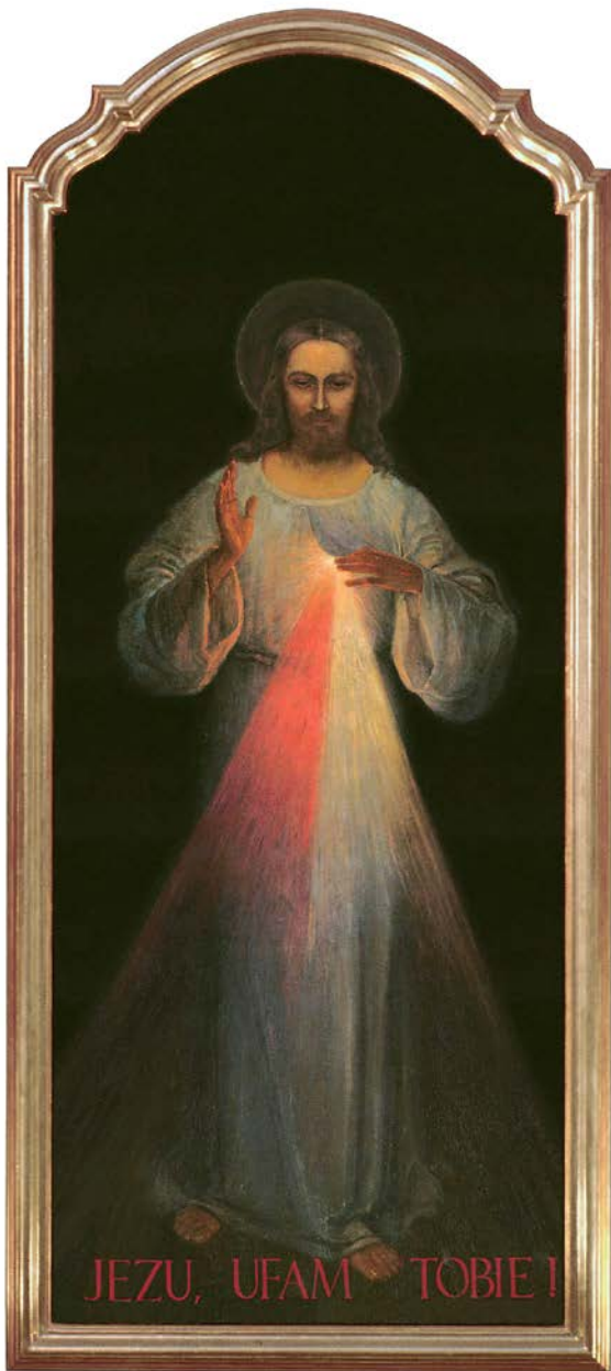
1. Eugeniusz Kazimirowski, pierwszy obraz Bożego Miłosierdzia, olej na płótnie, 1934, Wilno, sanktuarium Bożego Miłosierdzia