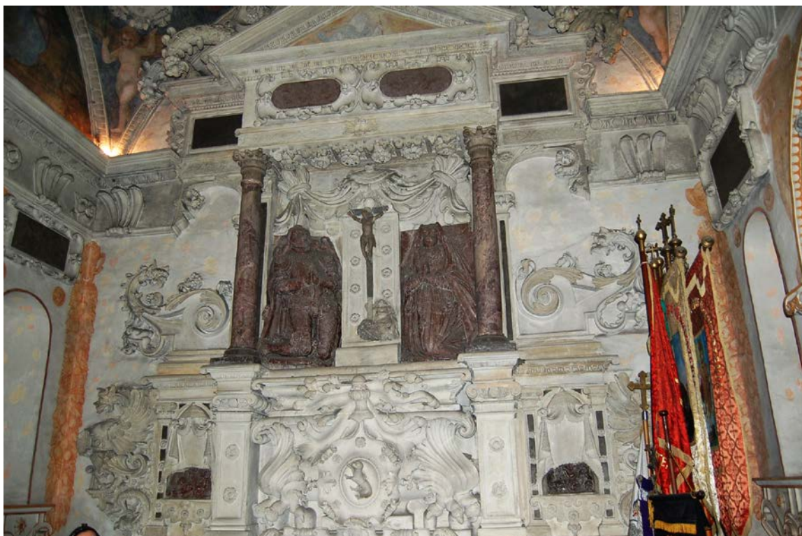
6. Nagrobek Firlejów w Bejskach