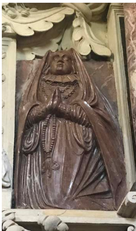
13. Elżbieta z Ligęzów Firlejowa

Firlejów edikulą z parą kolumn na postumentach i z trójkątnym przyczółkiem. Stwory zostały pokonane przez Chrystusa Zmartwychwstałego umieszczanego w zwieńczeniu nagrobka (il. 10).