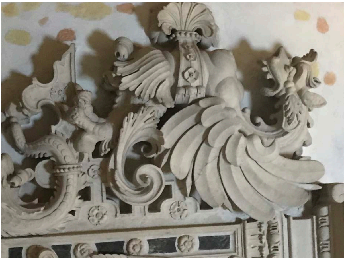
8. Smok z nagrobka Firlejów

szatana, śmierci. Ulisses Aldrovandi włoski uczonec, lekarz, przyrodnik, filozof i encyklopedysta z Bolonii, którego uczniem był Mikołaj Firlej, tłumaczył postać smoka, jako symbol wewnętrznej walki duchowej. Węża utożsamiał Aldrovandi z grzeszną duszą zatrutą własnym jadem 25 , a wyznawców luteranizmu łączył z apokaliptycznym smokiem o siedmiu głowach i dziesięciu rogach 26 . Piotr Skarga szlachcica wyznania protestanckiego nazywał wprost bezbożnym wyrodkiem, niesprawiedliwym drapieżcą, wężem jadowitym 27 .