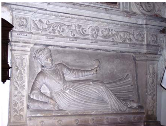
1. Nagrobek Elżbiety Firlejówny w kościele w Bejskach, fot. Irena Rolska