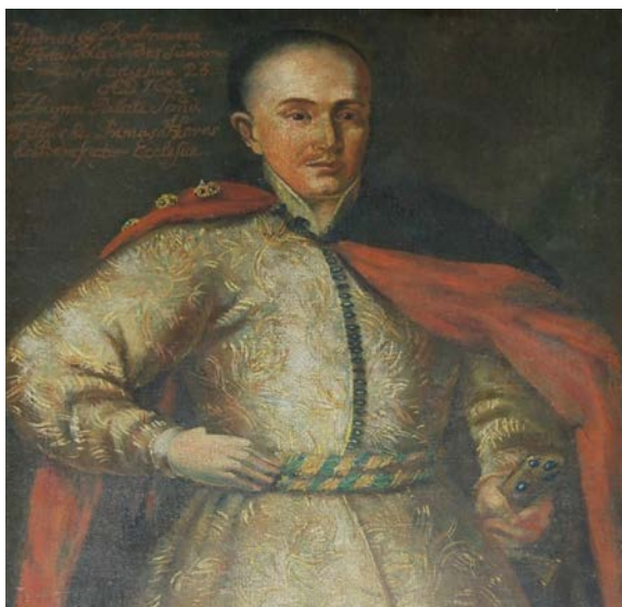
21. XIX-wieczna kopia portretu Andrzeja Firleja z kościoła p.w. św. Mikołaja w Bejskach

ufundowanemu przez siebie, klasztorowi karmelitów bosych w Czernej 47 .