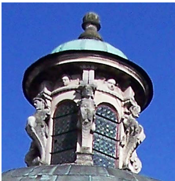
3. Latarnia na kaplicy Firlejów w Bejscach