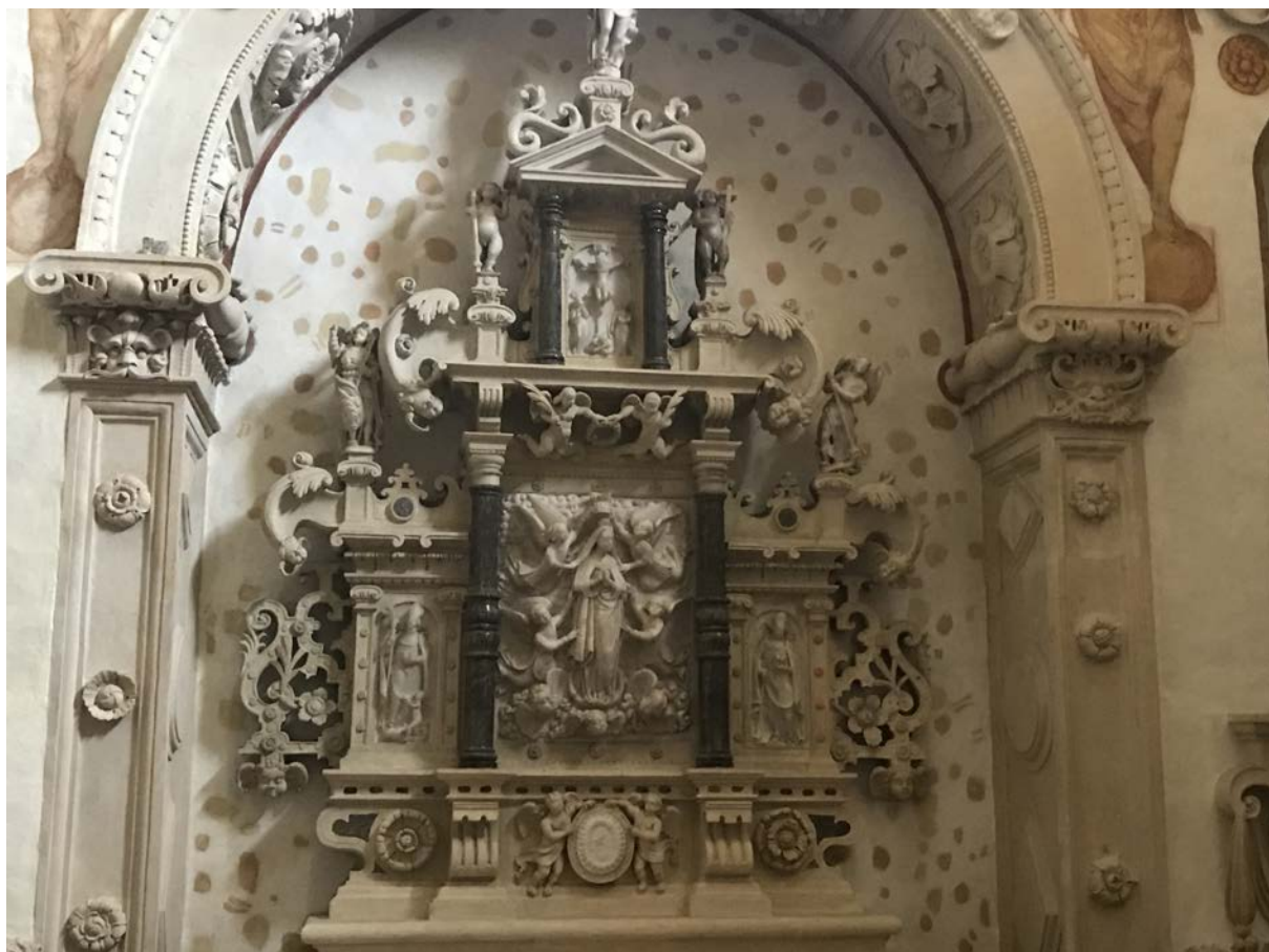
16. Ołtarz Wniebowzięcia NMP w kaplicy Firlejów w Bejskach

z nagrobka Firlejów została ufundowana dopiero przed rokiem 1678 przez prawnuka Mikołaja i Elżbiety, Mikołaja Andrzeja Firleja († po 1678) 35 .