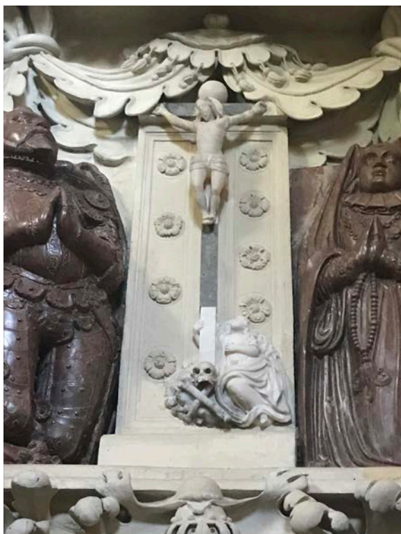
14. Krucyfiks z nagrobka Firlejów z Marią Magdaleną, fot. Irena Rolska