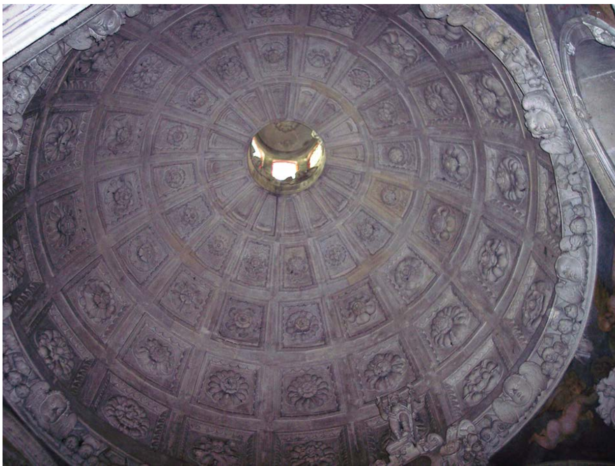
5. Kopuła kaplicy Firlejów w Bejscach

z pewnością forma budowli nawiązywała do twórczości architektonicznej zmarłego w roku 1583 Jana Michałowicza. Nie można wykluczyć, iż był on projektantem kaplicy Firlejów. We wnętrzu wzajemna relacja nagrobek – ołtarz nawiązuje do rozwiązań wewnątrz w mauzoleach projektowanych przez Jana Michałowicza. W nich także dominuje przede wszystkim pomnik 21 .