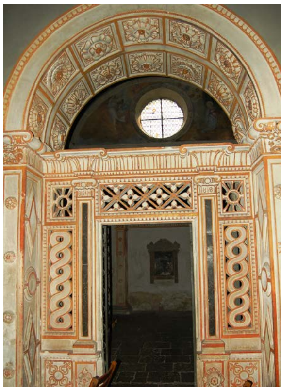
17. Bramka do kaplicy Firlejów w Bejskach (2009).

podtrzymujących belkowanie zaprojektowano zamkniętą półkuliście wnękę, wypełnioną rzeźbą figuralną. Być może towarzyszące ołtarzowi barokowe antepedium pochodziło z fundacji któregoś z potomków Mikołaja Firleja. W arkadach ścian tarczowych namalowano sceny Zwiastowania, Narodzin NMP i Pokłon Trzech Króli.