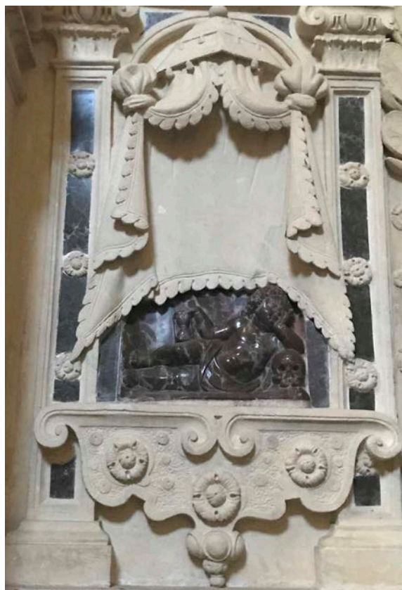
15. Putto z nagrobka Firlejów w Bejskach, fot. Irena Rolska

Postacie Firlejów zostały wstawione do istniejącego już nagrobka. Jednak, żeby umieścić je w środkowym polu, należało zrobić miejsce na ich stopy. W tym celu usunięto części baz kolumn i pilastrów. Zachwiana została struktura kompozycyjna nagrobka. W pomniku widoczne są też inne dysharmonie, m.in. brak zespolenia między krucyfiksem a fałdami zwisającego nad nim baldachimu 29 .