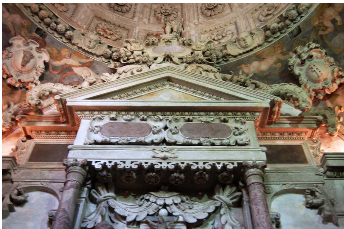
10. Zwieńczenie nagrobka Firlejów z figurą Chrystusa na szczycie