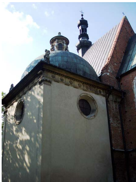
2. Mauzoleum Firlejów w Bejskach

Datowanie architektury kaplicy zostało zdeterminowane okresem powstania nagrobka Firlejów i określone na lata 1594-1600 (il. 2). Założona na planie kwadratu kaplica formą nawiązuje do wzorca kaplicy z kopułą z latarnią, wzniesioną bezpośrednio na murze, zaprojektowaną przez Bartolommeo Berrecciego jako mauzoleum biskupa Piotra Tomickiego na Wawelu w roku 1530. Architektura kaplicy Firlejów jest skromna, a jednocześnie bardzo wyważona. W gładkie, tynkowane, lekko pochylone ściany