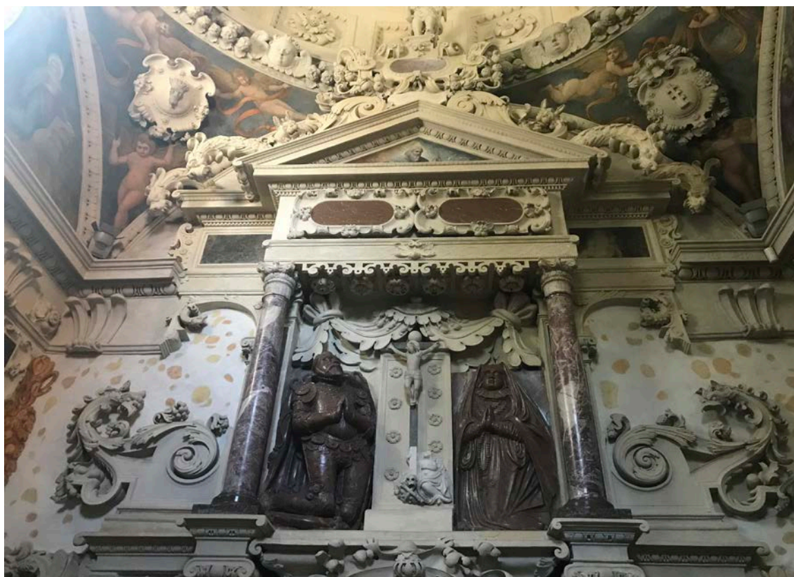
7. Fragment nagrobka Firlejów w Bejskach