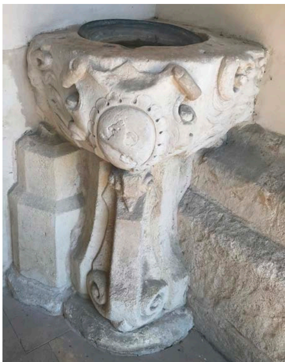
20. Kropielnica z herbem Firlejów przy wejściu do kościoła w Bejskach

sprawami familie stoją , w dolnej części była płyta z napisem: Piotr i Jakób Firlejowie dwaj bracia rodzeni a domu tego przodkowie żyli na świecie roku Bożego 1380 44 .