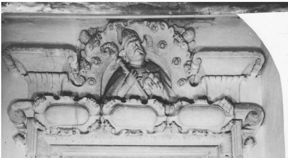
18. Portal kościoła p.w. św. Mikołaja w Bejskach

politykę rodową, wykorzystując do tego również sztukę, nawet w swoich dworach i pałacach podkreślali swoje pochodzenie. W przebudowanej krakowskiej kamienicy Bonerów – Firlejów zostały umieszczone na fasadzie herby z wywodem genealogicznym: Bończa praprababki Jadwigi Osmólskiej, prababki Gryf – Anny Mieleckiej, Topór – babki Katarzyny Tęczyńskiej oraz Bonarowa – matki Zofii Bonerówny 41 . W opisie z r. 1732 zapisano spodem zaś przy drzwiach kolumny po obu stronach kamienne wydrążone, nad którymi po obydwu stronach dwie osoby także kamienne 42 , zapewne były to stojące w niszach postacie rycerskich przodków Firlejów stanowiące charakterystyczną ozdobę ich siedzib. W pałacu w Dąbrowicy w niszach reprezentacyjnej fasady pojawiły się złożone postacie atentałów Firlejów 43 . Na zewnątrz dworu Firlejów-Broniewskich w Bronowicach w dwóch arkadach wspartych na cokole, z boku ujętych parą kolumn zostały umieszczone stojące postacie rycerzy. Pomnik zwieńczony był tarczą herbową z klejnotem, którą podtrzymywały lamparty. We fryzie umieszczono tablicę w obramieniu w postaci płaskich rollwerków i majuskułowym napisem: Cnotą i uczciwemu