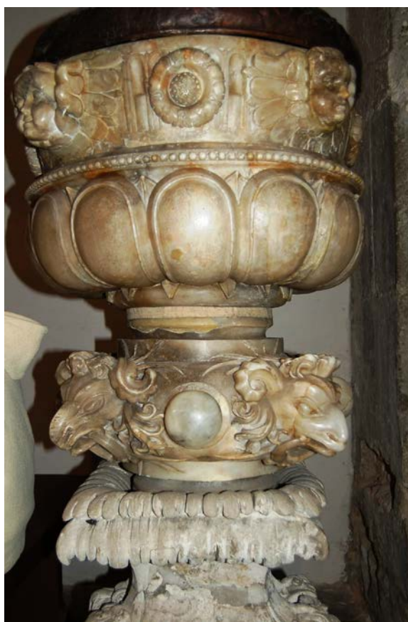
19. Alabastrowa chrzcielnica w kościele w Bejskach, fot. Irena Rolska