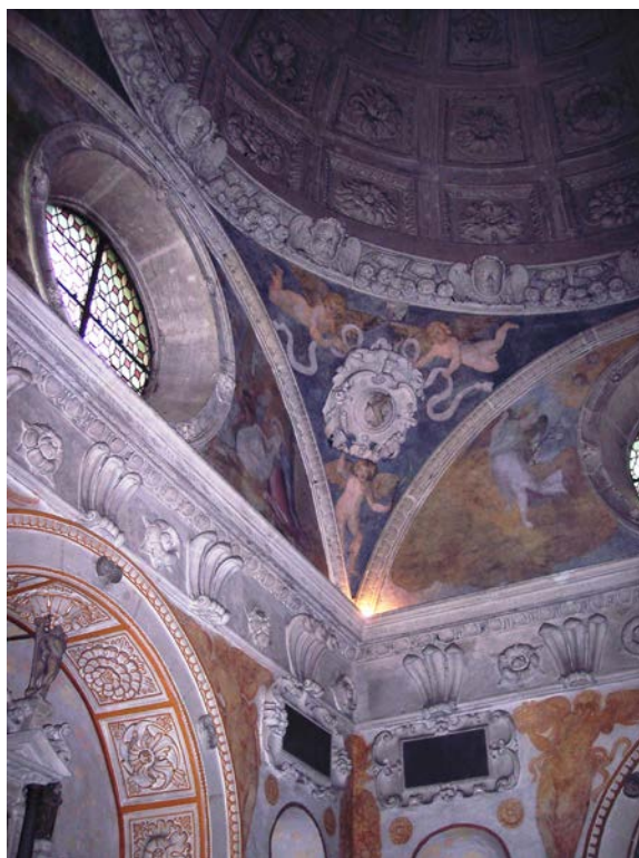
4. Wnętrze kaplicy w Bejscach

Równie prostymi środkami przy rozczłonkowaniu ścian posłużono się we wnętrzu kaplicy, gdzie przejęto tylko niektóre elementy trójprzelotowego łuku triumfalnego, tj. arkadowe wnęki środkowe z belkowaniem bez architrawu. Jest to jedyna artykulacja pionowa, co również zbliża