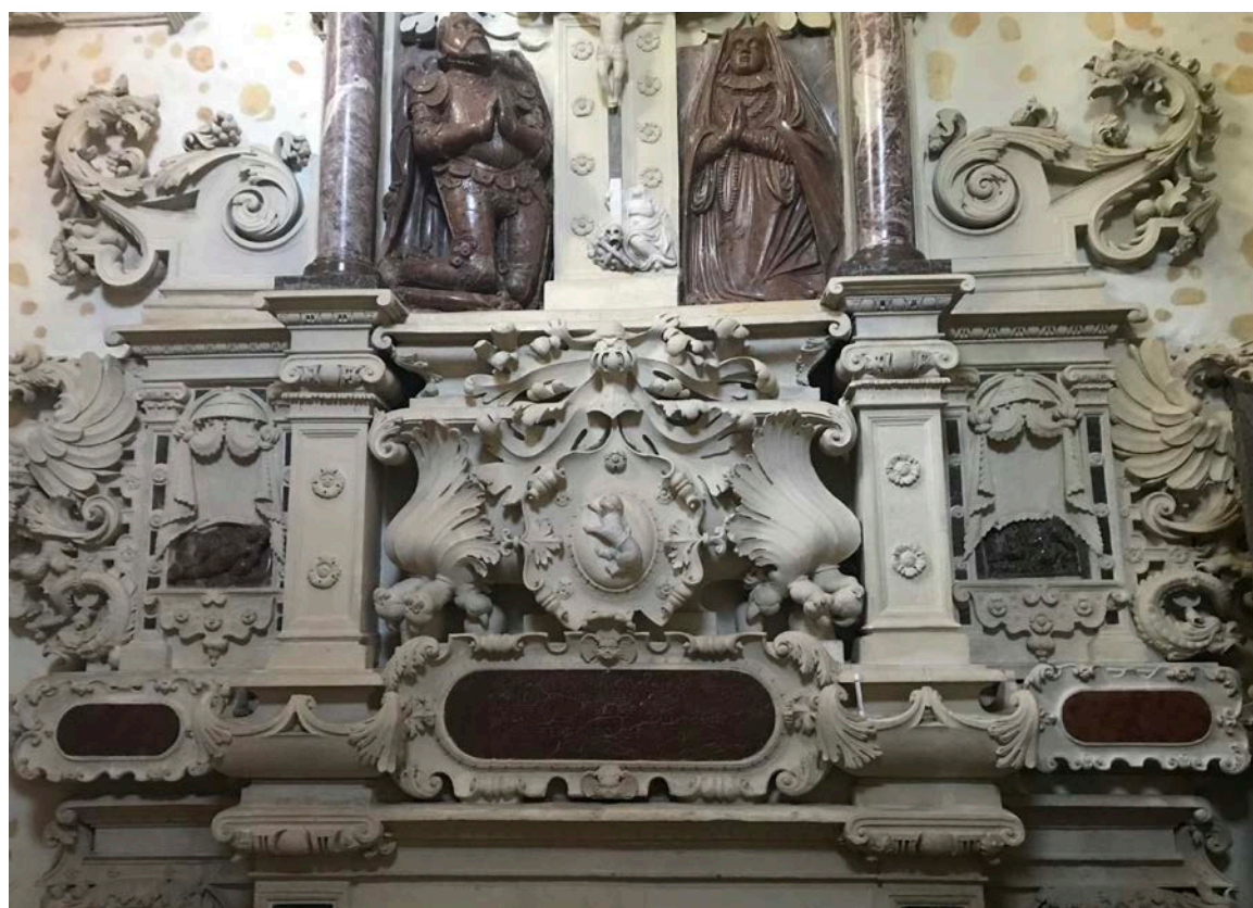
11. Fragment nagrobka Firlejów