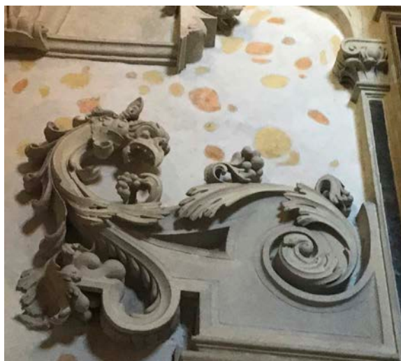
9. Smok z nagrobka Firlejów, fot. Irena Rolska

Smoki, węże, hybrydy na obramieniu nagrobka, mogły odnosić się do wcześniejszej wiary kalwińskiej Firleja. Nie mogły one przekroczyć porta coeli – bramy prowadzącej w zaświaty. Wrota te zostały podkreślone w pomniku