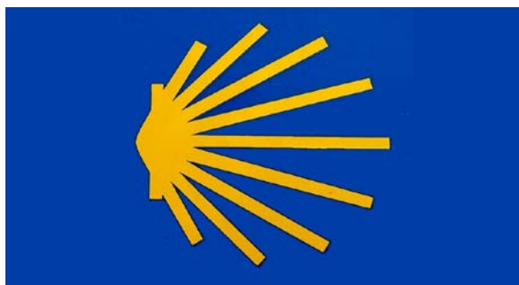
7. Znak drogi Jakubowej