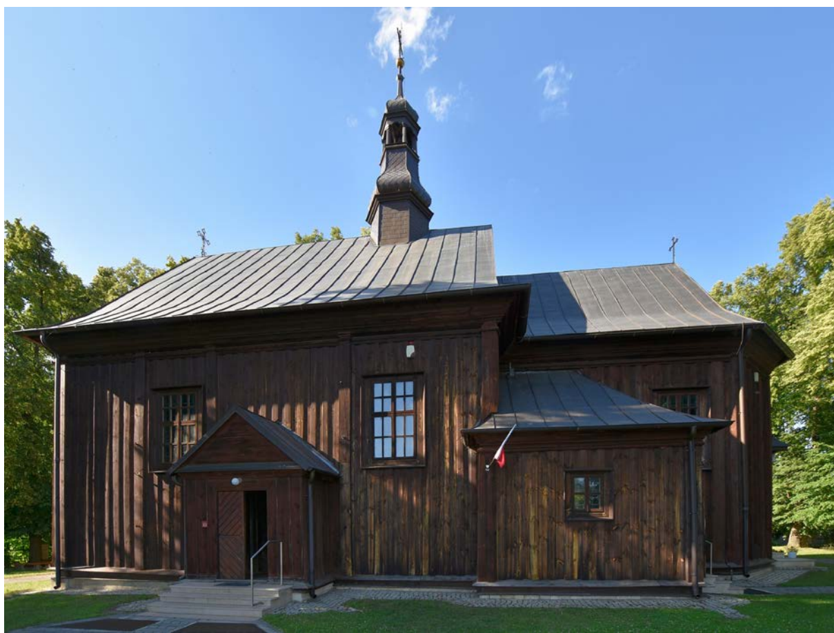
2. Probołowice, kościół św. Jakuba, 1759, fot. H. Bielamowicz

Kodeks Kalikstyński poświęca muszli Jakubowej więcej uwagi. Znajdujemy w nim m.in. informację, że: „niektóre skorupiaki w morzu w pobliżu Santiago, które zwykli ludzie nazywają przegrzebkami, mają dwie muszle, po jednej z każdej strony, między którymi, jak między dwiema płytkami, ukryty jest mięczak podobny do ostrzygi. Te muszle są wyrzeźbione jak palce dłoni, a kiedy pielgrzymi wracają z Sanktuarium w Santiago, przypinają je do swoich płaszczy na chwałę Apostoła i na jego pamiątkę i znak tak długiej podróży, z wielką radością przynoszą je do swojego mieszkania. Rodzaj zbroi, za pomocą której chronią się skorupiaci, oznacza dwa przykazania miłości, którymi powinni się bronić ci, którzy je należą noszą, to znaczy „kochać Boga ponad wszystko i kochać bliźniego jak siebie samego”. Ten dualizm widoczny jest nadto w symbolicznym odniesieniu skorupy muszli do dwóch Testamentów, Starego i Nowego 8 .