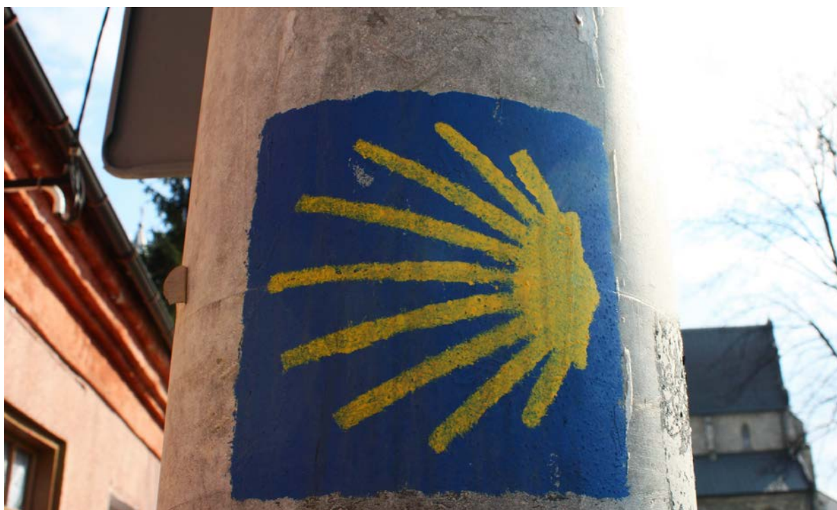
5. Znak drogi Jakobowej w Skalbmierzu