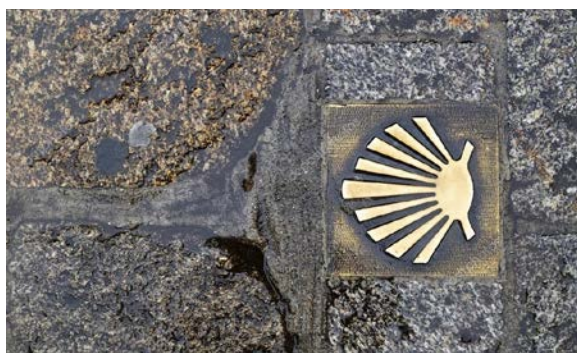
8. Znak drogi Jakubowej w bruku ulicznym

wrze morze wokół szczątków Urana, okaleczonych przez Kronosa. Nadto znajdujemy informacje o podróży Wenus, córki ognia i wody, w muszli kierującej się ku Cytherei. W świecie pogańskim muszla przegrzebka symbolizowała również płodność. Jej odniesienie do Wenus, przywoływało zarówno narodziny biologiczne, jak i inicjacyjne, śmierć i odrodzenie w innym, lepszym życiu. W ten sposób muszla łączy się z wodą do chrztu, symbolem oczyszczającym dla chrześcijan i młodego życia, życia w wierze 16 .