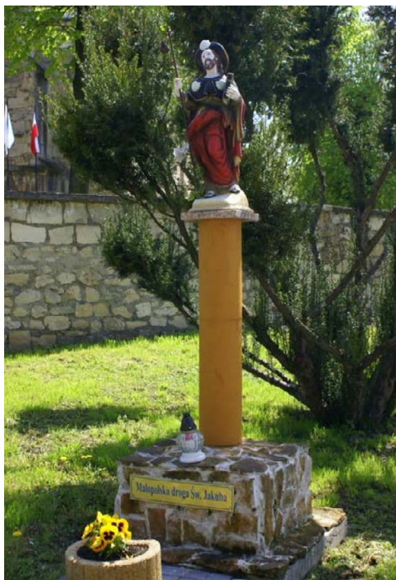
4. Statua św. Jakuba Starszego, Skalbmierz, figura współczesna