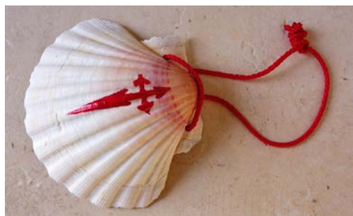
9. Muszla św. Jakuba, fot. Domena publiczna