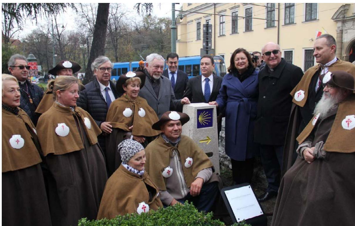
6. Inauguracja pierwszego oficjalnego obelisku Drogi św. Jakuba w Polsce, Kraków, 29 października 2019

młody i koń wynurzyli się z odmętów cali i zdrowi obok łodzi z ciałem św. Jakuba. Zaraz potem, gdy młodzieniec poszedł przywitać się z uczniami Apostoła, spostrzegł, że jego ciało jest pokryte muszlami przegrzebków. Wszyscy świadkowie tego wydarzenia uznali, że cudowne ocalenie pana młodego dokonało się za sprawą Apostoła Jakuba. Dlatego od tego momentu połączone zastały na zawsze: wizerunek Apostoła i muszla vieira 10 .