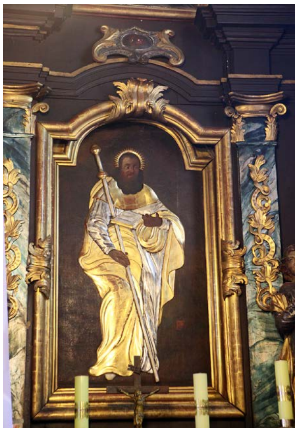
3. Obraz św. Jakuba Starszego, Probołowice, kościół św. Jakuba, XVIII w.